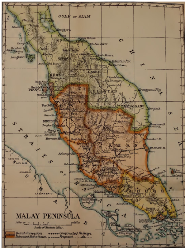
RAJAH 1. Peta Semenanjung Tanah Melayu pada Tahun 1900