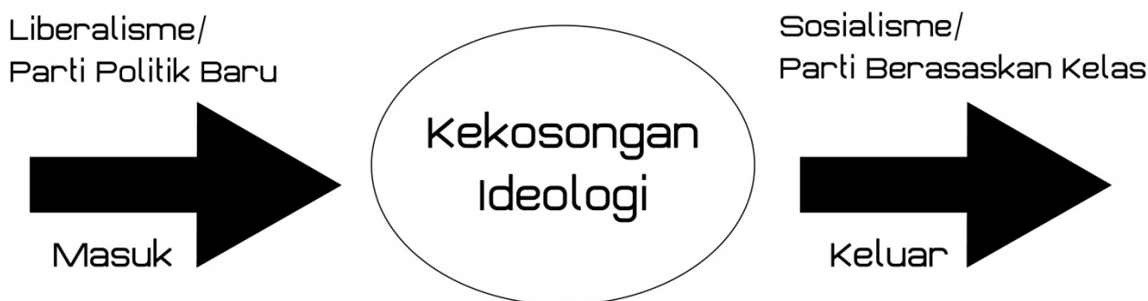
RAJAH 1. Pergerakan Keluar Masuk Ideologi

Menurut Giddens (1994) pula, pengelasan kiri dan kanan tidak lagi mewakili pegangan ideologinya secara eksplisit (nyata). Ideologi baru sukar diletakkan dalam kategori yang membezakan kiri dan kanan. Spektrum politik pada satu-satu masa dan keadaan menurut White (2010), sering bertukar posisi, menggunakan kedudukan antara satu sama lain yang menunjukkan tindakannya pragmatik. Dalam erti kata, parti yang berorientasikan campuran pragmatik boleh digolongkan sebagai centrist mengikut kedudukan spektrum politik. Pragmatik merujuk kepada aliran pemikiran yang berpandangan 'di mana ada kepentingan di situ mereka akan berada.' Ideologi liberalisme yang berada pada kedudukan tengah spektrum menerangkan sifat kecairannya yang berubah dari semasa ke semasa dan tidak substantif terhadap satu aliran – sama ada ke kanan diletakkan sebagai kanan-tengah atau ke kiri diposisikan sebagai kiri-tengah. Hal ini bertepatan dengan hujah pemikir