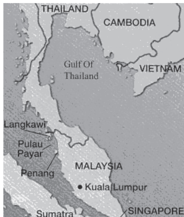
PETA 1. Lokasi Langkawi Geopark

Senario di atas menunjukkan Langkawi telah melalui beberapa anjakan pembangunan dan telah berjaya mempertahankan kekentalannya melalui pengubahsuaian dan penambahbaikan sistem pengurusan yang diperlukan untuk menghadapi cabaran akibat perubahan. Dalam masa yang sama keperluan dan permintaan pelbagai kumpulan