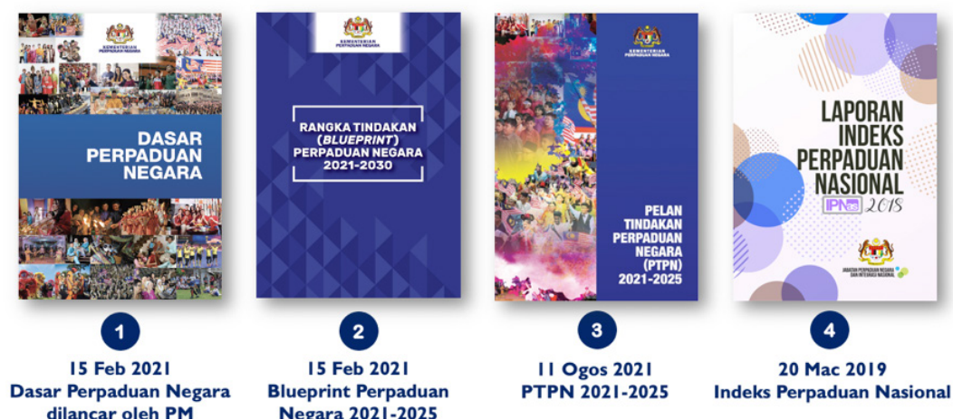
RAJAH 2. Dokumen Utama Kerajaan Berkenaan Perpaduan Negara

Perlu juga dinyatakan dengan pengenalan konsep perpaduan tiga serangkai ini, pihak Kementerian Perpaduan Negara telah menjadikannya konsep asas dalam membina Dasar Perpaduan Negara (DPN, Rangka Kerja (Blueprint) Perpaduan Negara RKP, Pelan Tindakan Perpaduan Negara (PTPN) dan Indeks Perpaduan Nasional (IPNas).