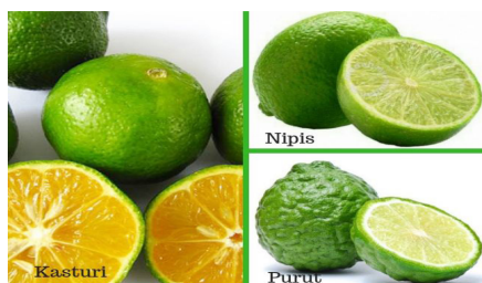
RAJAH 8. Limau kasturi, Limau Nipis, Limau Purut

Secara spesifik limau membersihkan kotoran seperti darah kotor, rambut, kuku, kaca, tulang dan miang buluh akibat dari sihir dan juga membersihkan kotoran rohani seperti kegelisahan, perasaan marah dan sedih.