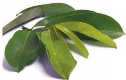
RAJAH 4. Daun Durian Belanda

Menurut pengamal perubatan Melayu 1 beliau menggunakan daun Durian Belanda dalam rawatannya untuk merawat pesakit yang mengalami sakit kulit kerana daun durian belanda dapat berfungsi membersihkan kotoran atau membunuh kuman yang ada pada kulit pesakit. Secara spesifik daun Durian Belanda membersihkan dari kotoran seperti bakteria, parasit dan kuman pada kulit.