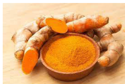
RAJAH 9. Kunyit

membersihkan dari kotoran seperti kuman, kulat dan bakteria dan membersihkan kotoran daki dan darah kotor pada wanita selepas bersalin.