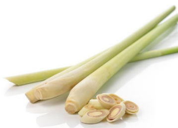
RAJAH 7. Serai

Menurut pengamal perubatan Melayu 5 beliau menggunakan serai digunakan untuk membersihkan kotoran orang wanita semasa berpantang dan juga berfungsi membersihkan rohani mereka. Secara spesifik serai membersihkan dari kotoran seperti daki dan darah bagi wanita berpantang dan membersihkan kotoran rohani seperti tekanan perasaan dan kegelisahan.