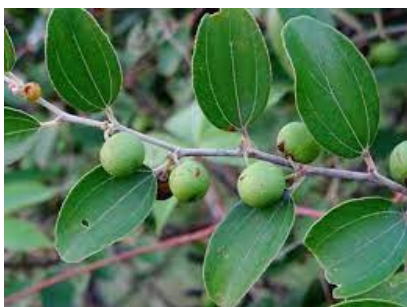
RAJAH 1. Daun Bidara

Berdasarkan Jadual 1 di atas kesemua informan menggunakan daun bidara untuk membersihkan kotoran dalam badan pesakit yang berpunca dari gangguan saka dan sihir atau santau. Mereka juga menggunakan daun bidara untuk membersihkan rohani pesakit. Secara spesifik daun bidara membersihkan kotoran seperti lendir kotor, nanah, bahan-bahan sihir berupa makanan kotor yang bercampur dengan rambut dan kuku, miang buluh dan juga digunakan untuk membersihkan kekotoran rohani seperti tekanan perasaan, kegelisahan, kesedihan dan ketakutan.