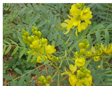
RAJAH 5. Daun Gelenggang

Menurut pengamal perubatan Melayu 1 beliau menggunakan daun gelenggang untuk membersihkan kotoran di dalam perut pesakit yang terkena sihir melalui bahan makanan. Secara spesifik daun gelanggang membersihkan dari kotoran bahan sihir seperti darah hitam, rambut dan kuku.