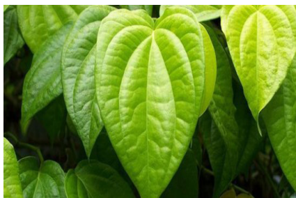
RAJAH 3. Daun Sirih