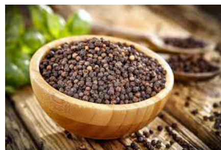
RAJAH 10: Lada Hitam

Menurut pengamal perubatan Melayu 2 beliau menggunakan lada hitam untuk membersihkan dan membuang kotoran pada pesakit yang mengalami masalah kulit di kepala seperti kudis di kepala. Beliau juga menggunakannya untuk membersihkan rohani pesakit. Secara spesifik lada hitam membersihkan dari kotoran seperti kudis dan kencing kotor.