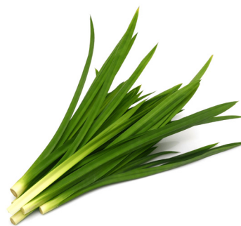
RAJAH 2. Daun Pandan

Menurut pengamal perubatan Melayu 4 beliau menggunakan daun pandan sebagai agen pembersih untuk merawat penyakit kulit sama ada akibat dari gangguan sihir atau hanya sakit fizikal. Ia juga digunakan untuk membersihkan rohani pesakit terutama dalam menghilangkan tekanan perasaan dan juga kegelisahan. Secara spesifik daun pandan membersihkan kotoran seperti kuman dan bakteria pada kulit serta membersihkan bahan sihir dari badan seperti darah hitam, kuku dan rambut.