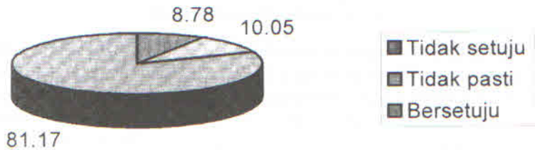
RAJAH 3. Peratus skor kepuasan pengguna bagi pembolehubah kecekapan sistem rangkaian

Hasil analisis mendapati kakitangan teknikal dan khidmat sokongan merupakan unsur-unsur penting yang menentukan tahap kecekapan sistem. Unsur ini turut membantu meningkatkan kecekapan dan kepuasan pengguna. Boleh dirumuskan bahawa kecekapan sesuatu sistem bergantung kepada kualiti khidmat teknikal. Kekurangan khidmat teknikal yang baik membuatkan sistem yang dilaksanakan kurang memuaskan hati pengguna.