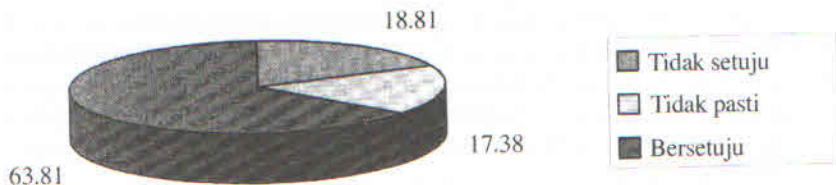
RAJAH 4. Peratus skor kepuasan pengguna bagi pembolehkan ketersediaan sistem rangkaian