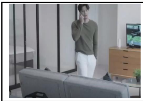
Rajah 3: Pemberian salam ketika menjawab telefon