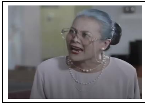
Sumber: Drama My Coffee Prince (2017)

Dalam drama ini, antara penggunaan dialog yang memaparkan elemen Islam adalah menerusi episod ke 4 di mana pada babak ini kedengaran jelas Puan Sri Khaltom yang juga merupakan nenda kepada Raikal sedang dalam keadaan marah apabila cucunya, Raikal dikatakan tidak menghormati dan melanggar ajaran Islam dengan mengamalkan gaya hidup songsang (menyukai kaum sejenis). Seperti yang sedia maklum, Islam merupakan sebuah agama yang sememangnya tidak membenarkan umatnya untuk menyukai sesama jantina dan menzalimi kaum sebegini. Menurut Noor Hafizah Haridi et al. (2016) Islam, secara jelas menolak perlakuan lesbian, gay, bisexual, transgender dan questioning/queer (LGBTQ).