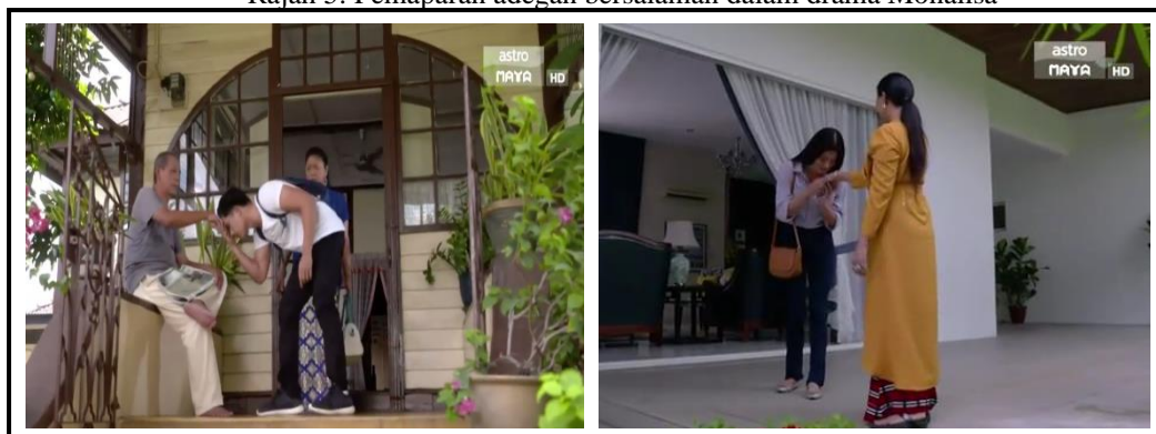
Rajah 5: Pemaparan adegan bersalaman dalam drama Monalisa

Menurut Rashidah Othman et al. (2016) menutup aurat merupakan fitrah semula jadi setiap manusia dan ianya juga adalah merupakan suatu kewajipan bagi golongan wanita. Tambahnya, ini merupakan perkara yang telah disyariatkan dalam Islam untuk memelihara kesucian kaum wanita itu sendiri dari perkara yang tidak baik.