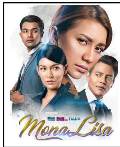
Sumber: Poster drama Monalisa (2018)