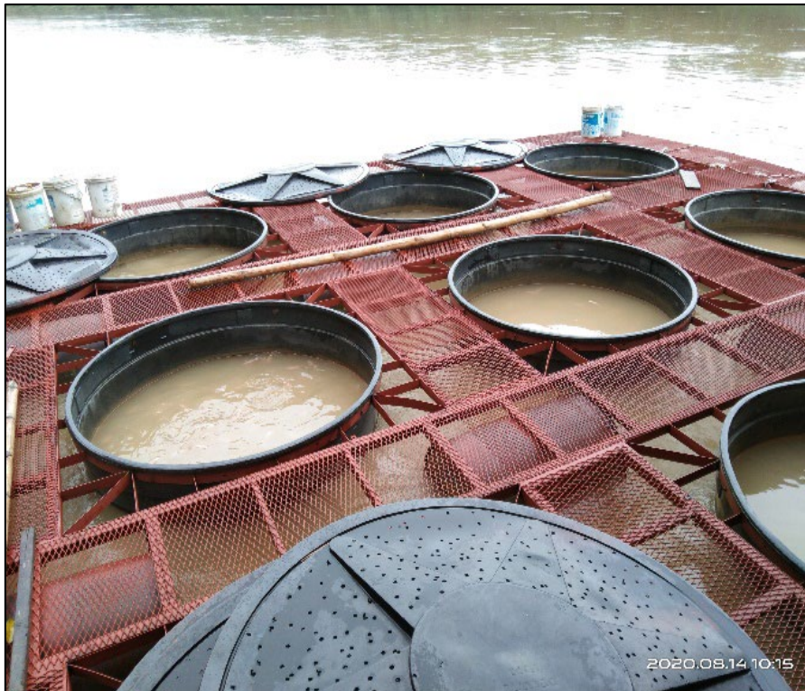
Rajah 3. Polytank berbentuk bulat dengan kapasiti air dianggarkan 2.5 m 3 yang diletakkan secara terapung, dikelilingi kerangka besi, di dalam sungai