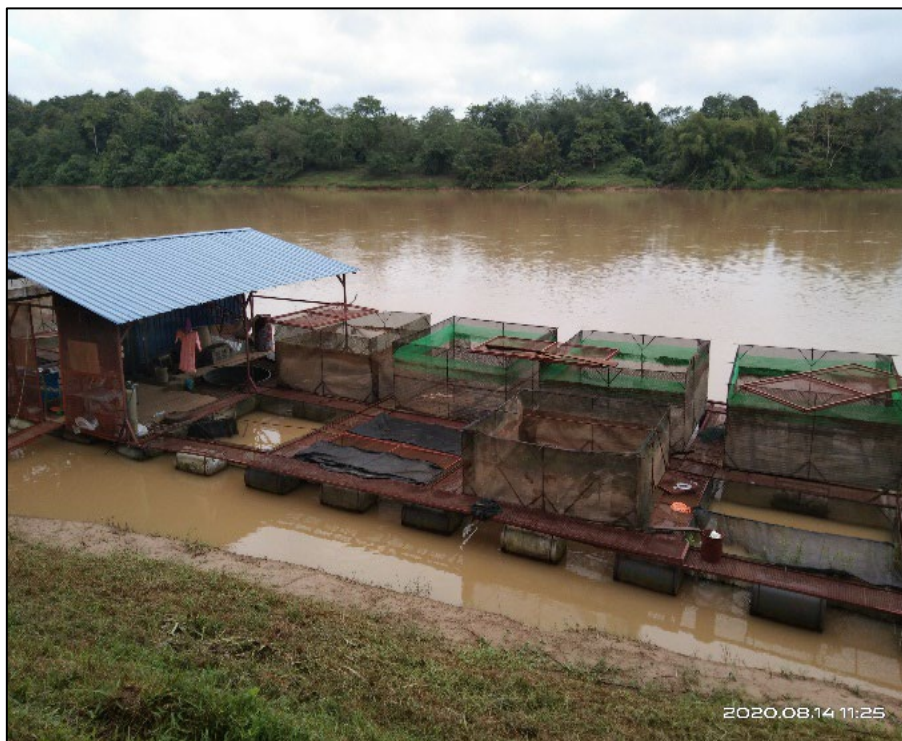
Rajah 2. Sangkar jaring konvensional dengan kapasiti air dianggarkan 10 m 3