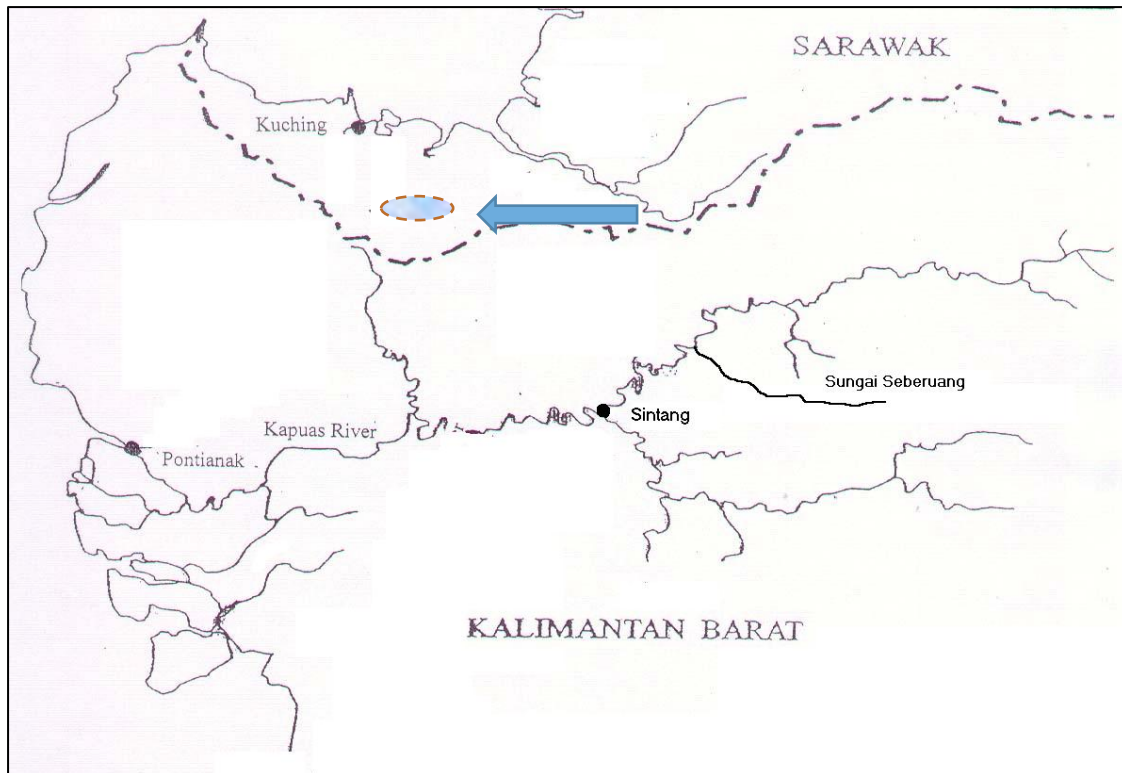
PETA 1. Peta daerah pertuturan bahasa Remun