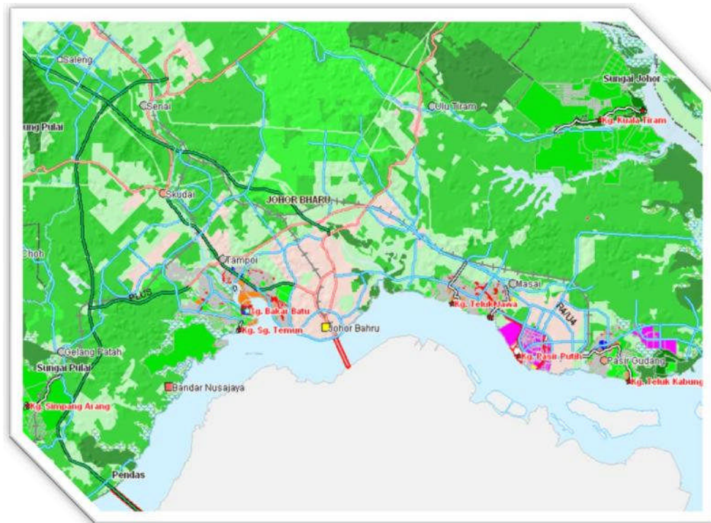
Peta 2. Taburan perkampungan komuniti Orang Seletar Daerah Johor Bahru

Di antara lapan buah kampung tersebut, Kampung Bakar Batu dan Kampung Sungai Temun adalah merupakan dua buah kampung yang paling hampir dengan bandar Johor Bahru. Jarak Kampung tersebut dari pusat bandar Johor Bahru adalah sekitar 25 km sahaja. Kampung-kampung lain walaupun berada lebih 30km dari Johor Bahru, tetapi adalah berdekatan pula dengan bandar lain seperti Bandar Gelang Patah dan Bandar Pasir Gudang. Ini menunjukkan, berbanding dengan komuniti Orang Asli lain yang terdapat di negara ini, komuniti Orang Seletar adalah merupakan komuniti yang tinggal begitu hampir dengan persekitaran bandar. Ertinya mereka bukanlah komuniti yang terasing atau terpisah daripada perubahan dan pembangunan yang berlaku begitu pesat di bandar. Adalah dijangkakan mereka lebih berpeluang menerima pendedahan kepada kemajuan dan kehidupan bandar. Justeru mereka akan menjadi lebih sensitif untuk mengubah corak kehidupan supaya menjadi lebih sesuai dengan budaya bandar, kerana pendedahan kepada persekitaran Bandar Johor Bahru. Kertas ini bertujuan untuk menilai impak pembangunan wilayah Iskandar kepada mereka.