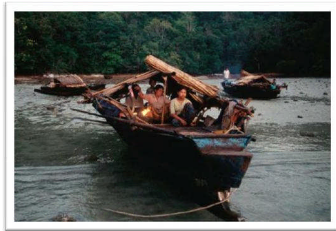
Gambar 1. Perahu Kajang

tersebut adalah kira-kira 20 kaki panjang, dan disitulah mereka menikmati keselesaan kehidupan. Di salah satu hujung sampan tersebut ialah dapur tempat memasak, ditengah-tengah sampan ini menjadi tempat mereka menyimpan perkakasan yang dimiliki dan di hujung yang satu lagi, biasanya dilengkapi dengan bumbung kajang yang panjangnya sekitar 6 kaki, menjadi tempat mereka tidur serta tempat anjing atau kucing yang mereka pelihara. Di bawah ini dipaparkan gambar sampan atau perahu yang pernah menjadi tempat mereka hidup.