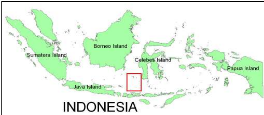
Rajah 1. Kawasan kajian