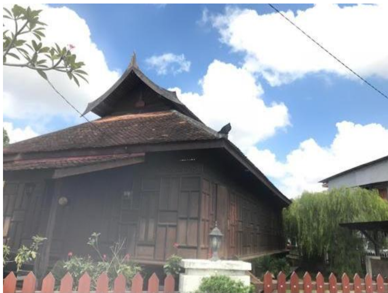
Rajah 1. Masjid Lama Kedai Mulong pada masa kini.

sebagai masjid. Penduduk kampung telah membeli struktur dan komponen bangunan ini dengan harga RM1000 pada tahun 1958. Pada ketika itu, penduduk kampung Kedai Mulong tidak mempunyai masjid. Tindakan penduduk kampung untuk mengubah fungsi balairung seri kepada masjid membuktikan perubahan tahap penyertaan dari pasif ke aktif menerusi kerangka Tangga Penyertaan Masyarakat (Arnstein, 1969). Hal ini dapat dilihat apabila kerja-kerja mengubahsuai fungsi balairung ini dilakukan secara gotong royong oleh komuniti setempat untuk diubah kepada masjid. Ubah suai ini juga mendapat bimbingan dan kerjasama dari JWN yang turut membantu penduduk kampung daripada segi teknikal, pemantauan dan pendanaan. Pemerhatian di lapangan mendapati, pada masa kini masjid ini tidak lagi digunakan untuk solat Jumaat kerana kekangan saiznya yang tidak mencukupi untuk menampung bilangan jemaah. Penduduk kampung akan mengerjakan solat Jumaat di masjid baharu yang terletak berhampiran Masjid Ar-Rahman ini. Meskipun begitu masjid lama ini masih terus dikunjungi oleh penduduk sekitar bagi menunaikan solat lima waktu berjemaah dan menjalankan aktiviti keagamaan lain (Rajah 1).