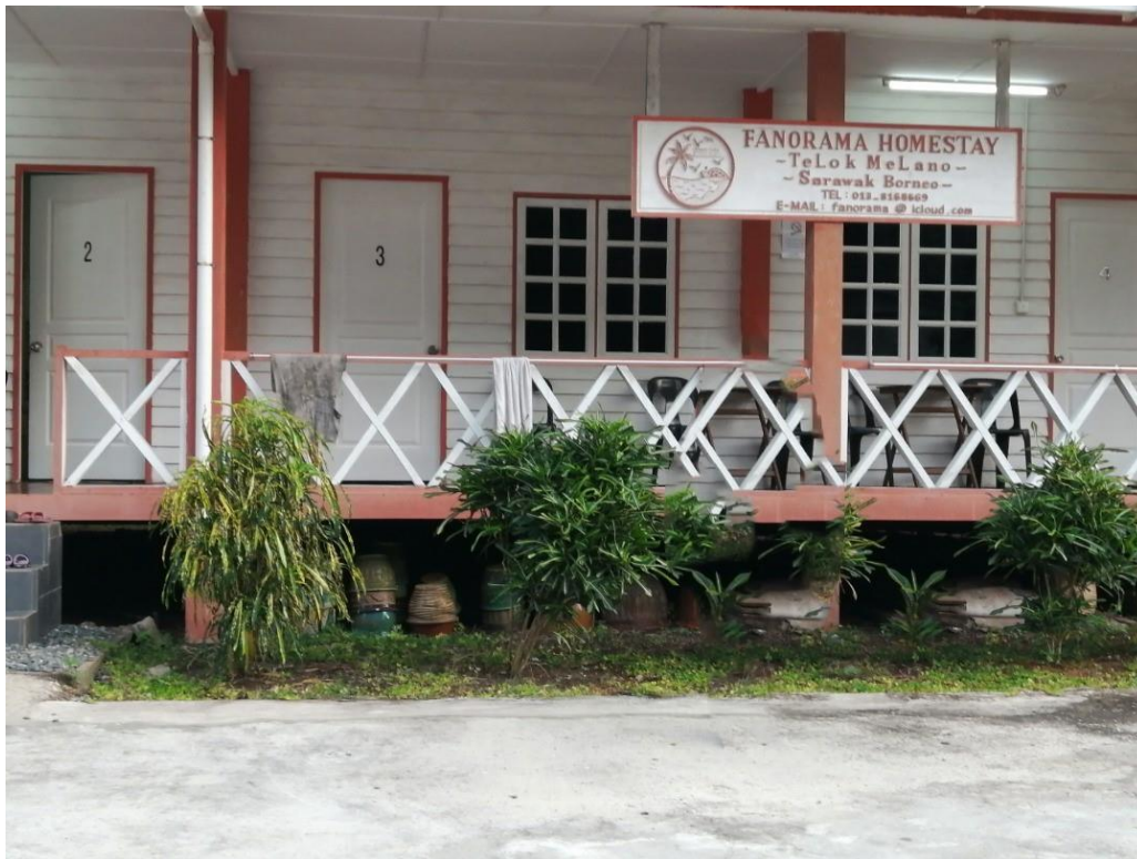
Rajah 4. Inap desa yang telah dikembangkan.

berkembang dengan penambahan bilik di lot tanah pengusaha. Sebagai contoh Fanorama Homestay (lihat Rajah 4) telah menyediakan bangunan penginapan yang berstruktur teres manakala Hornbill Homestay menyediakan unit-unit penginapan yang tunggal.