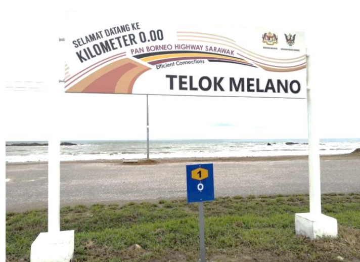
Rajah 3. Tugu Titik KM0.00 di Telok Melano.