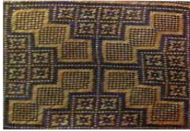
ILUSTRASI 1. Seni Ukiran Islam Corak Arabesque Motif Geometri