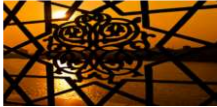
ILUSTRASI 7. Seni Ukiran Islam Corak Arabesque Motif Jalinan Kaligrafi Arab Bentuk Zukhruf