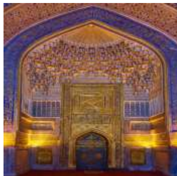
ILUSTRASI 3. Seni Ukiran Islam Corak Arabesque Motif Geometri Bentuk Muqarnas .