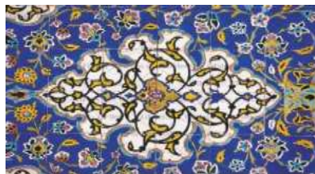
ILUSTRASI 5. Seni Ukiran Islam Corak Arabesque Motif Tabi'i Unsur Flora