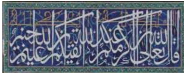
ILUSTRASI 4. Seni Ukiran Islam Corak Arabesque Motif Jalinan Kaligrafi Arab

bangsa di seluruh dunia seperti Parsi, Turki, India, Afrika, Melayu dan sebagainya. Ayat-ayat suci al-Quran menjadi teras dan sumber inspirasi penciptaan corak arabesque dengan motif ini dan ianya terdapat dalam pelbagai bentuk merangkumi gaya Nasakh , Thuluth , Rihan , Diwani Jali , Diwani , Ta'liq Farisi , Koufi dan Riq'ah (Oloan, 1993).