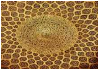
ILUSTRASI 2. Seni Ukiran Islam Corak Arabesque Motif Unsur Kosmos (Matahari).