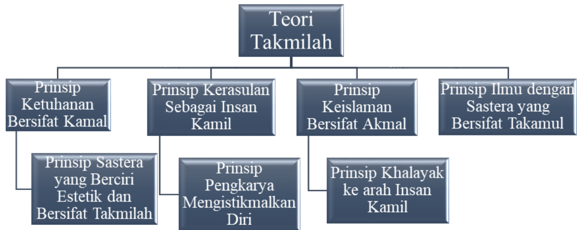
RAJAH 1. Kerangka Teori Takmilah