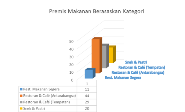
RAJAH 1. Premis Makanan Berasaskan Kategori

Rajah 1.1 menunjukkan taburan premis makanan mengikut kategori. Data menunjukkan bahawa premis makanan dikaji terdiri daripada 11 restoran makanan segera, 44 restoran & kafe antarabangsa, 29 restoran dan kafe tempatan serta 20 premis snek dan pastri. Sebahagian besar premis makanan ini mewakili restoran dan kafe (84 premis atau 80%) dan selebihnya adalah premis snek dan pastri. Secara keseluruhan, kajian juga melibatkan 77 peratus premis yang terdapat di pusat beli belah terbabit.