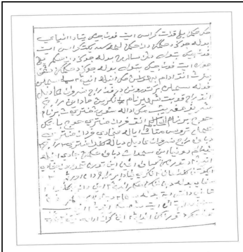
RAJAH 2. Salinan faksimilile Undang-Undang Sembilan Puluh Sembilan Perak

ini tercatat Sayid Ja'afar bin Sayid Unus yang berkhidmat selaku Dato' Penghulu Kuala Teja di dalam daerah Kinta, Negeri Perak dan pada halaman kedua salinan ini mencatatkan manuskrip ini dikurniai oleh Raja Haji Yahya.