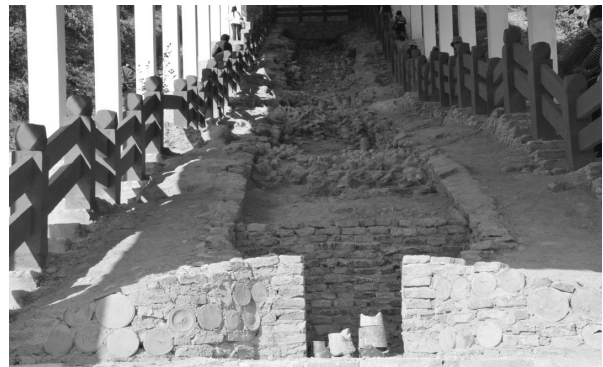
FOTO 5. Satu lagi dapur jenis “naga” tradisional zaman Ming yang ditemui di dapur pembakaran Na Ann, di Fujian.