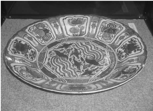
FOTO 3. Pinggan porselin Swatow abad 15 Masihi.

di tapak tanur Jingdezhen dan di bahagian perairan tenggara pelabuhan China selatan. Perindustrian porselin biru dan putih ketika ini mendapat saingan yang hebat terutamanya daripada pengeluar dan pengusaha porselin dari Jepun. Walau bagaimanapun, perindustrian porselin biru dan putih China ini telah diambil alih dan disambung perusahaannya ketika pemerintahan Dinasti Ching antara pertengahan abad 17 Masihi hingga ke awal abad 20 Masihi (1644 – 1912).