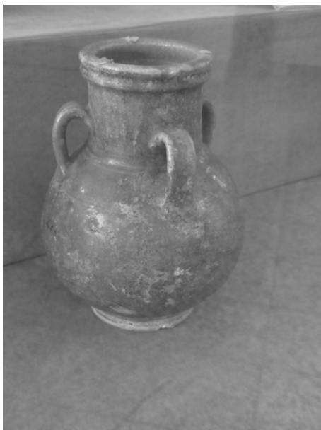
FOTO 11. Seramik jenis Samarra yang terdapat di Muzium Tehran, Iran.

Seramik jenis ini hanya ditemui di beberapa kawasan sahaja di Semenanjung Malaysia. Antara bukti yang terdapat penemuan seramik jenis ini ialah di tapak arkeologi Lembah Bujang dan Pulau Tioman. Para pedagang dari Timur Tengah khususnya dari Parsi atau Iran pernah menyebut dalam sumber bertulis mereka tentang kewujudan dua tempat tersebut sebagai 'Kadaha' atau 'Kataha' yang merujuk kepada Kedah dan 'Tiyumah' yang merujuk kepada Tioman. (Nik Hassan Shuhaimi Nik Abdul Rahman & Othman Yatim 2006. 90). Ciri-ciri, bentuk dan warna seramik dari Timur Tengah ini agak berbeza dengan seramik dari China. Jenis seramik yang dieksport ke kawasan ini adalah dari jenis tembikar batu, berwarna biru kehijauan atau juga dikenali dengan nama 'The Mohammadian Blue'.