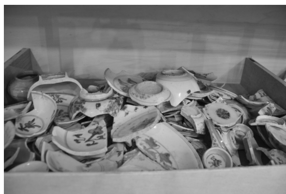
FOTO 1. Kebanyakan seramik perdagangan yang terdapat di tapak arkeologi di Semenanjung Malaysia berada dalam keadaan pecah.

Seramik yang terdapat di Semenanjung Malaysia terdiri daripada pelbagai jenis, warna dan corak hiasan. Ada yang berasal dari tempatan dan ada yang diimport. Seramik tempatan lebih kepada jenis tembikar tanah seperti buyung, kendi, mangkuk, geluk, periuk dan tempayan tanah. Manakala seramik yang diimport pula ialah seperti tempayan, mangkuk, kendi dari jenis tembikar tanah dari China abad 18–19 Masihi, tembikar tanah berglais dari China abad 19 Masihi, tembikar tanah Thailand abad 15–18 Masihi, tembikar tanah Khmer abad 15 Masihi, tembikar batu China abad 11–19 Masihi, tembikar batu Thailand seperti Sukhothai dan Sawankhalok abad 13–15 Masihi, tembikar batu Vietnam abad 15 Masihi, tembikar batu Khmer abad 15 Masihi, porselin China jenis celadon zaman Song abad 11–13 Masihi, porselin putih zaman Song abad 11–13 Masihi, porselin China zaman Ming abad 15–17 Masihi, porselin China zaman Ching abad 18–19 Masihi, porselin Eropah abad 19 Masihi, porselin Vietnam abad 15–16 Masihi, porselin Temuku dari Jepun, porselin dari Timur Tengah dan beberapa jenis tembikar yang lain. (Asyaari Muhamad 2005: 12)