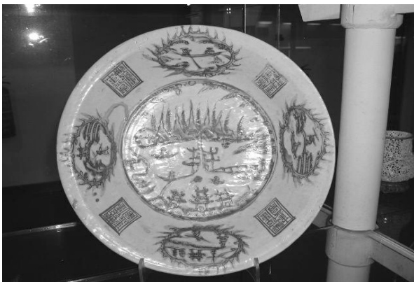
FOTO 4. Pinggan porselin Swatow di Muzium Seni Asia.