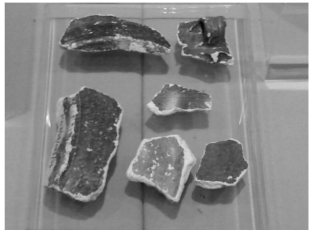
FOTO 12. Pecahan seramik Timur Tengah yang terdapat di Lembah Bujang