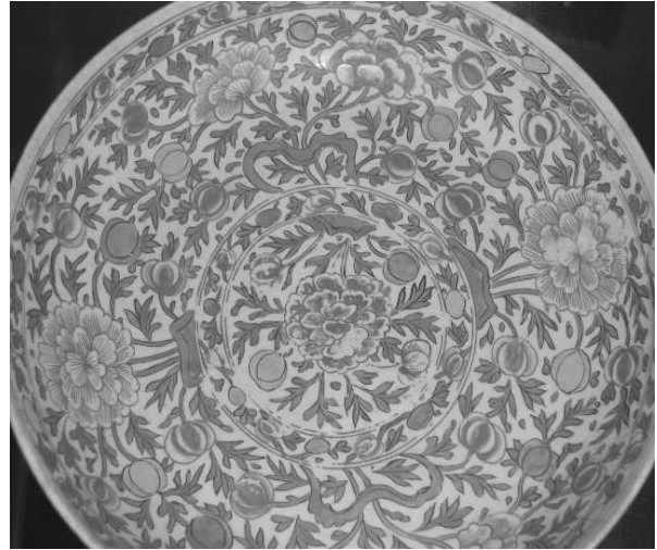
FOTO 6. Famille Verte zaman Kiang-Hsi