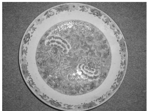
FOTO 7. Famille Rose abad ke- 18 Masihi.