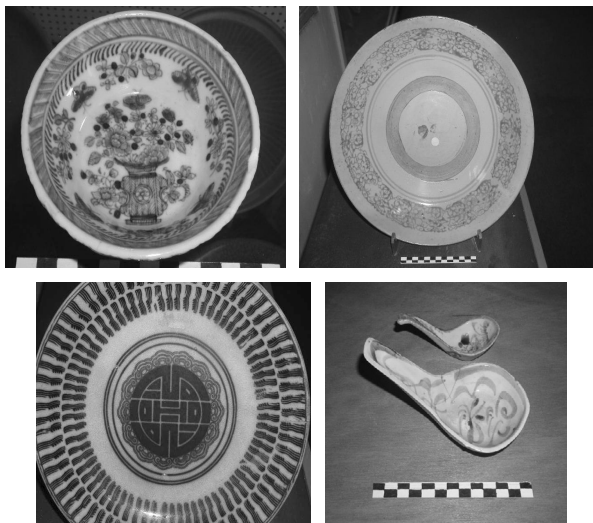
FOTO 8. Tembikar porselin Kitchen-Ching abad 19 Masihi.