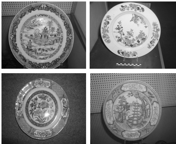
FOTO 10. Seramik Eropah abad 19 Masihi