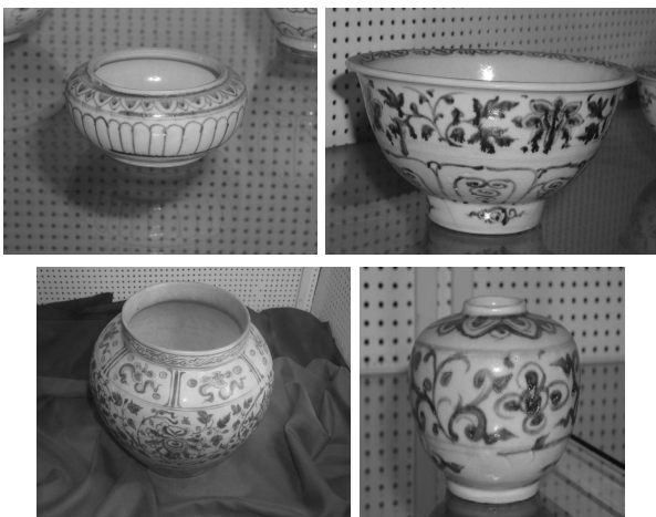
FOTO 9. Seramik Biru dan Putih abad 15 Masihi dari Vietnam.