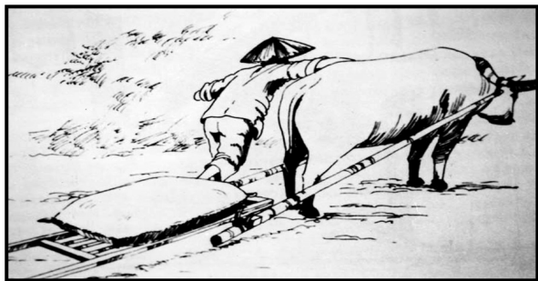
RAJAH 1. Lakaran menunjukkan kerbau ketika menarik guni padi dengan menggunakan anor (atau dikenali juga sebagai anak)