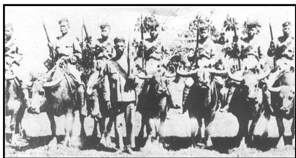
FOTO 1. 'Skuad Terbang' Polis Tempatan dengan Kerbaunya pada tahun 1700-an