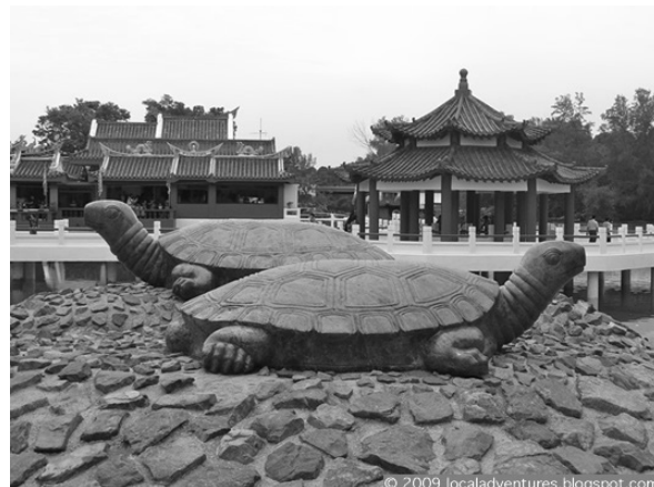
FOTO 5. Replika kura-kura di Pulau Kusu

Kaedah yang sama turut dikongsi oleh negara Singapura apabila mereka turut membina replika besar yang berkaitan langsung dengan cerita-cerita lisan di sana. Kisah Merlion yang menampilkan watak singa dan berekor ikan serta kisah Pulau Kusu yang unik dengan watak kura-kura gergasi telah diabadikan dalam binaan yang sangat menarik di kawasan pelancongan Pulau Sentosa dan Pulau Kusu (lihat foto 4 dan 5). Wujudnya replika tersebut seolah-olah cerita lisan itu terus ‘diceritakan’ kepada khalayak umum atau pelancong yang melawat di kawasan berkenaan. Bentuk patung yang aneh sedemikian akan mengundang ghairah pelancong untuk mengetahui apakah cerita sebenar di sebalik replika itu. Dalam situasi sedemikian, pastinya seperti di Malaysia, cerita lisan Merlion dan Cerita Pulau Kusu di Singapura akan terus diingati ramai.