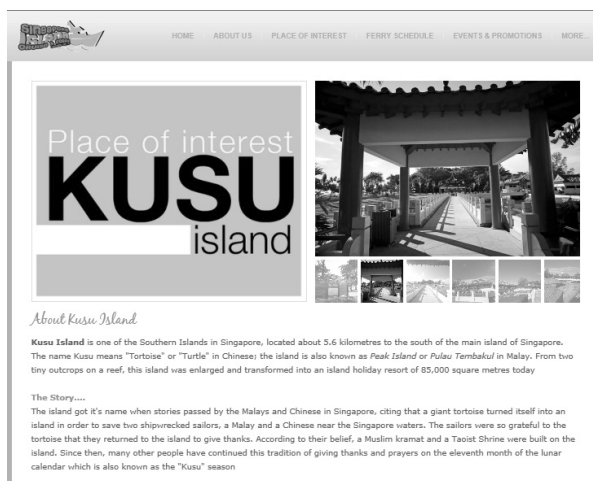
RAJAH 3. Laman web berkaitan Pulau Ubin

Selain itu di Singapura juga dilihat turut memasukkan Kisah Pulau Kusu dalam web pelancongan mereka tentang Pulau Kusu. Cerita tentang dua orang nelayan yang diselamatkan oleh seekor kura-kura gergasi yang akhirnya mereka membina tempat ibadat di tempat tersebut sebagai tanda kesyukuran menjadikan promosi tempat tersebut bertambah menarik. Hal ini disebabkan pulau itu sekarang memang terkenal dengan tempat ibadat dan sering dikunjungi oleh orang ramai dan pelancong. Dalam konteks ini, cerita lisan secara tidak langsung menjadi salah satu sumber maklumat terhadap keadaan sesuatu tempat.