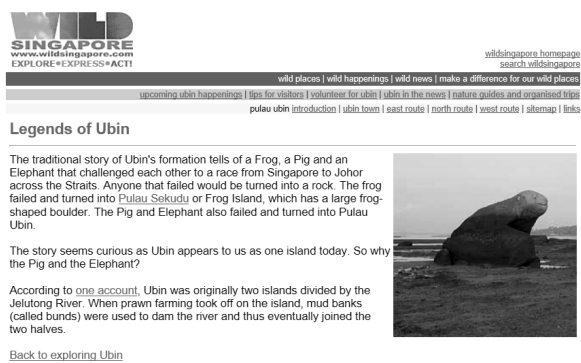
RAJAH 2. Laman web pelancongan berkaitan Pulau Ubin

Selain itu di Singapura juga dilihat turut memasukkan Kisah Pulau Kusu dalam web pelancongan mereka tentang Pulau Kusu. Cerita tentang dua orang nelayan yang diselamatkan oleh seekor kura-kura gergasi yang akhirnya mereka membina tempat ibadat di tempat tersebut sebagai tanda kesyukuran menjadikan promosi tempat tersebut bertambah menarik. Hal ini disebabkan pulau itu sekarang memang terkenal dengan tempat ibadat dan sering dikunjungi oleh orang ramai dan pelancong. Dalam konteks ini, cerita lisan secara tidak langsung menjadi salah satu sumber maklumat terhadap keadaan sesuatu tempat.