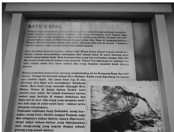
FOTO 3. Catatan Legenda Batu Kapal di Muzium Sejarah Gunung Jerai