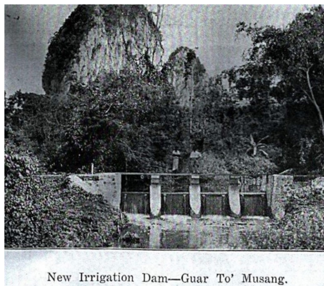
GAMBAR 2. Empangan-empangan kecil atau Belat baharu di Guar To' Musang

Pembangunan sistem pengairan yang lebih bersistematik bukan sahaja memberi manfaat kepada kegiatan penanaman padi semata-mata. Sistem ini secara tidak langsung meningkatkan kualiti hidup masyarakat setempat kerana mendapat bekalan air yang bersih dan terawat ( Perlis Annual Report 1938 ). Perkara ini direkodkan seperti berikut: