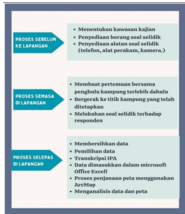
RAJAH 2. Proses penyelidikan lapangan

Dalam kajian ini penulis telah menetapkan tiga jenis golongan responden, iaitu golongan remaja yang berumur 15–25 tahun, golongan dewasa yang berumur 25–55 tahun dan golongan tua yang berumur 56 tahun dan ke atas. Rasionalnya pemilihan ketiga-tiga jenis golongan ini adalah untuk melihat varian kata ‘ular’ yang digunakan oleh masyarakat di negeri tersebut. Ajib Che Kob (1995) menjelaskan bahawa golongan tua lebih gemar menggunakan dialek kawasannya berbanding dengan golongan muda seperti remaja dan kanak-kanak. Hal ini berlaku kerana wujudnya pengaruh semasa seperti pendidikan dan media sosial yang diterima oleh golongan muda atau dikenali juga sebagai generasi Z. Manakala, golongan dewasa