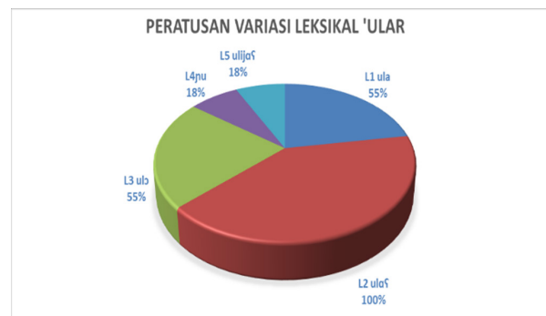
RAJAH 3. Peratusan variasi leksikal “Ular” di negeri Kedah

dan Sik pula, didapati masing-masing menggunakan tiga varian bagi merujuk leksikal ular. Tiga varian yang sama ditemui di Baling, Padang Terap, Pokok Sena dan Sik, iaitu L1 [ula], L2 [ulaʃ] dan L3 [ulo]. Di daerah Kulim juga ditemui tiga varian, namun berbeza satu varian dengan keempat-empat daerah yang lain, iaitu L1 [ula], L2 [ulaʃ], L4 [ul]. Bagi daerah Kota Star dan Kuala Muda masing-masing ditemui dua varian, iaitu bagi daerah Kota Star, L1 [ula], L2 [ulaʃ] dan daerah Kuala Muda pula ialah L2 [ulaʃ]. Seterusnya terdapat dua daerah yang ditemui menggunakan satu varian, iaitu varian L2 [ulaʃ] yang masing-masing mewakili daerah Bandar Baharu dan daerah Yan. Bagi mendapatkan gambaran mengenai peratusan penggunaan variasi leksikal ‘ular’ di negeri Kedah, dibawakan carta pai seperti Rajah 3.