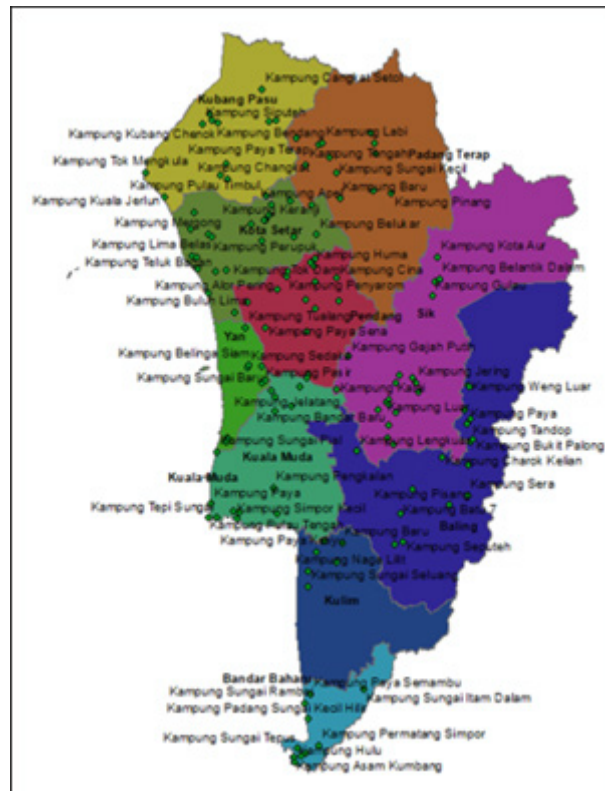
RAJAH 1. Titik kampung bagi kawasan kajian di negeri Kedah