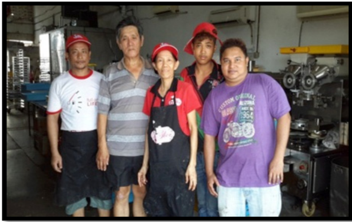
Rajah 1.6: Pekerja Kilang Pastrri Goh