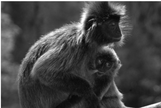
Gambar 8 Bayi lutong kelabu yang masih menyusu

Alloparent ialah individu yang bukan induk sebenar yang membantu menjaga anak di dalam kumpulan (Barrows 2000). Ini sering dilaksanakan oleh primat betina atau primat jantan. Ianya termasuk ahli keluarga pada semua peringkat umur kecuali juvenil (Wilson 1975). Allomothering adalah pemeliharaan anak oleh ibu tumpang yang terdiri daripada ibu saudara yang bersama saling menjaga dan memelihara bayi lutong. Allomothering dicerap hanya dalam beberapa spesies primat termasuk lutong kelabu (Hu et al. 2005; Kumar et al. 2005; Mitani & Watts 1997). Sistem penjagaan bayi bagi kebanyakan primat mungkin tidak banyak perbezaannya. Tetapi setiap spesis pasti mempunyai keistimewaan atau keunikan masing-masing. Contohnya dalam siamang, secara semulajadi induk jantan menghabiskan masa yang bukan sedikit dengan mendukung, mendandan, dan bermain dengan bayi (Chivers 1974; Palombit 1992).