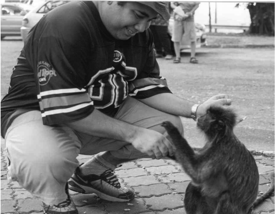
Gambar 9 Interaksi lutong kelabu dengan penulis di Bukit Melawati

Bulu pada bayi lutong kelabu berwarna jingga terang dan putih pada bahagian kulit muka, tangan dan kaki. Ciptaan Allah sangat spesifik dengan hikmahNya yang sendiri. Bayi yang mengalami perubahan warna bulu apabila warna bulu menjadi lebih gelap selepas 3-5 bulan (Brandon-Jones et al. 2004) didapati kurang diberi perhatian berbanding bayi yang berwarna oren (baru dilahirkan). Tetapi induk betina akan terus menjaga dan menyusu bayi hingga 2 tahun (Gambar 8). Selepas tempoh ini, penolakan berlaku dan hubungan ibu-anak semakin tidak jelas (Jin et al. 2009; Napier & Napier 1967). Faktor kecomelan ( cute factor ) menjadi satu mekanisma kemandirian semua bayi haiwan (Hrdy 1999; Majolo et al. 2005) termasuk manusia (Cooper et al. 2006). Faktor kecomelan bayi juga menjadi satu tarikan kepada dewasa betina untuk penjagaan bayi seperti dalam kebanyakan Cercopithecinae (kera dan baboon). Jantan dewasa juga kadangkala dilihat mendukung bayi (Bernstein 1968). Ini sangat benar dalam manusia yang boleh diperhatikan kecomelan bayi juga boleh mendorong dalam penjagaan bayi.