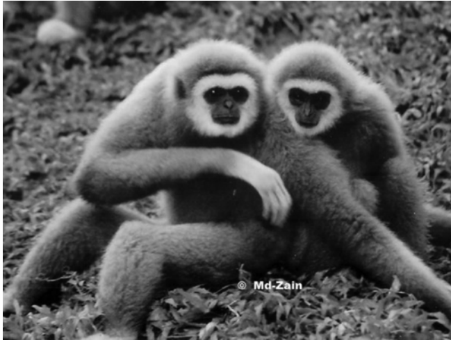
Gambar 7 Ungka tangan putih yang mempunyai institusi kekeluargaan secara monogami

oleh induk jantan dewasa dalam keluarga primat (Matsuda et al. 2009). Primat jantan Cercopithecidae boleh berpindah ke kumpulan lain sedangkan primat betina adalah philopatry lebih setia untuk berada di dalam kumpulan (Chapais & Berman 2004). Oleh itu, peranan lutong dewasa betina juga dapat dilihat dari aspek keistimewaan lain seperti menjadi teman utama kepada jantan dewasa dan kelakuan persahabatan dengan betina yang lain dalam kumpulan yang sama.