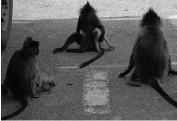
Gambar 6 Interaksi lutong kelabu di antara induk betina yang berpoligami dalam satu kumpulan

Tiga kelakuan utama lutong kelabu yang dibincangkan dalam artikel ini berfokuskan kepada peranan induk jantan sebagai ketua, allomothering atau ibu bapa tumpang dalam penjagaan bayi dan proses pendamaian atau pengurusan konflik dengan hubungan sosial antara kumpulan betina yang berbilang. Ketiga-tiga kelakuan ini telah diperhatikan dalam kajian terdahulu (Aswaniza 2003; Mohd-Daut 2005).