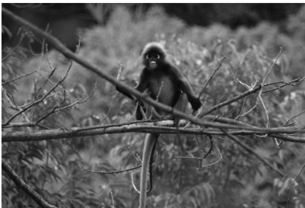
Gambar 2 Lutong celak ( Trachypithecus obscurus )