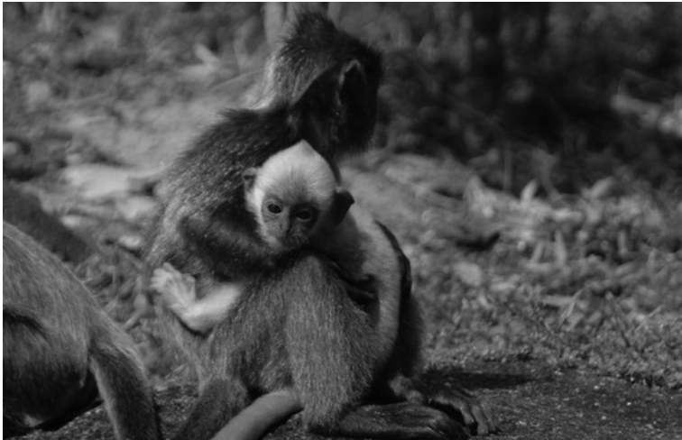
Gambar 5 Penjagaan bayi lutong kelabu oleh ahli saudara terdekat dalam kumpulan

pokok turut memberikan kesan kepada organisasi sosial yang berbeza bagi kedua-dua subfamily (McKenna 2011). Antaranya adalah kekurangan persaingan untuk makanan dalam kumpulan (Matsuda et al 2010; McKenna 2011), kadar interaksi yang tinggi kesan dari ruang untuk mendapatkan sumber makanan yang dekat (McKenna 2011) serta pengurangan kepentingan dominan antara primat betina (McKenna 2011). Kemahiran penjagaan bayi oleh primat subdewasa (Gambar 5) diperolehi dengan pengendalian dan pengangkutan bayi kurang umur empat minggu (McKenna 2011).