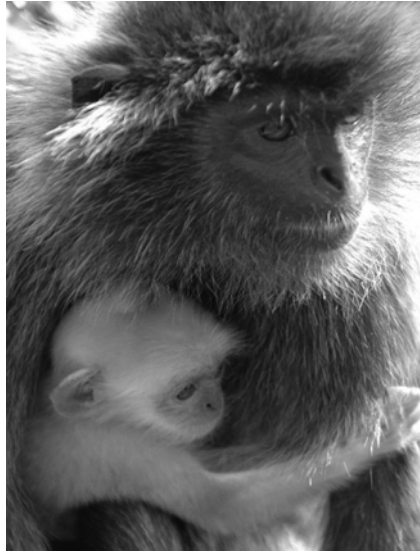
Gambar 3 Bayi lutong kelabu yang berwarna jingga