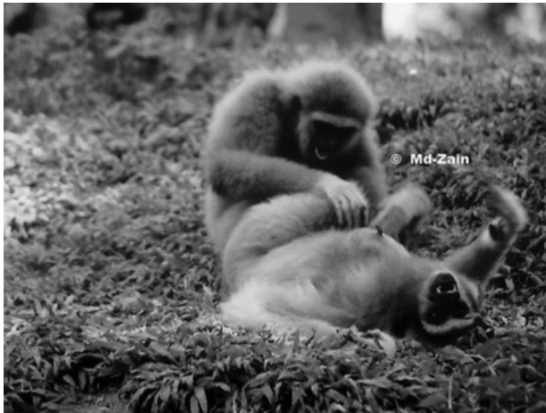
Gambar 1 Aktiviti berdandan ( grooming ) oleh ungka tangan putih

pertalian persaudaraan yang rapat (McKenna 2011; Simonds 1974). Antara kelakuan primat yang didorong oleh motivasi dan nalurinya adalah seperti kawalan keluarga oleh kera dominan dengan bersepakat bersama peninjau yang terdiri daripada kera dewasa dan kera sub-dewasa (Farhani 2010; Treves 1999), amaran vokal oleh lutong terhadap kumpulan Monyet Bonnet ( Macaca radiata ) apabila kelihatan pemangsa (Ramakrishnan & Coss 2000). Induk betina lutong celak putih ( Trachypithecus obscurus ) (Gambar 2) dan kebanyakan primat lain menghabiskan masa lebih dari satu pertiga masanya untuk membersihkan dan mendandan ahli kumpulannya (Arnold & Barton 2001).