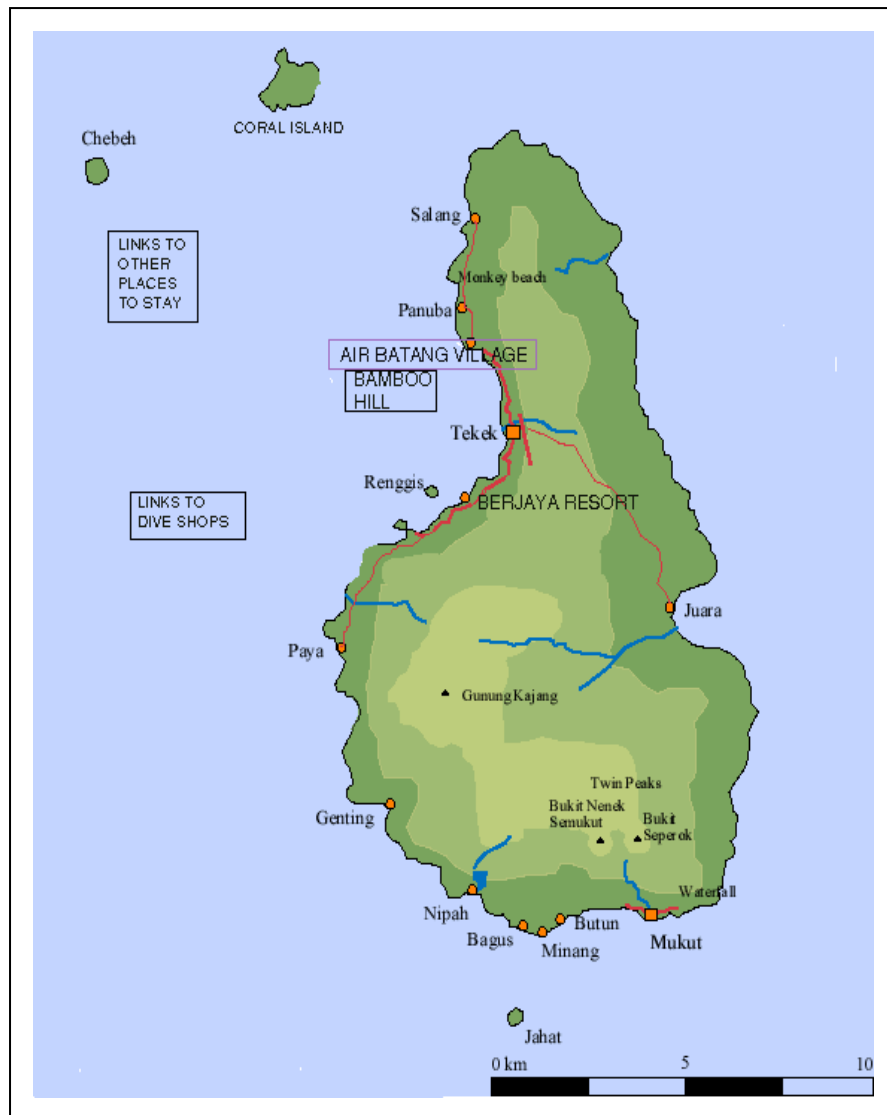
Peta 1: Pulau Tioman dan Petempatan Utama

Komuniti Pulau Tioman terdiri daripada Melayu tradisional. Sebelum aktiviti pelancongan dibangunkan iaitu sekitar awal 1970-an, ekonomi utama penduduk di pulau ini bergantung sepenuhnya kepada aktiviti menangkap dan menjual ikan serta hasil laut yang lain. Kini jumlah keseluruhan penduduk di Pulau Tioman adalah seramai 3,201 orang dengan majoriti (86%) ketua keluarga terlibat dengan industri pelancongan. Jika diambil kira dengan pekerja hotel (termasuk orang luar) jumlah penduduk di sini ialah sekitar 5,000 orang.