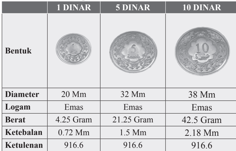
Jadual 2.3 : Spesifikasi Dinar Emas Public Gold

Sumber: Public Gold. 2009. http://www.publicgold.com.my . [9 Jun 2009]