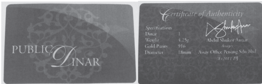
Gambar 2.15 Sijil Ketulenan Dinar Emas Public Gold 10