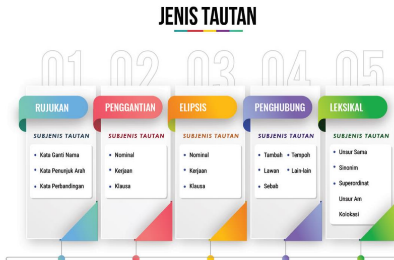
RAJAH 1. Model Tautan Halliday dan Hasan (1976)

Menelusuri aliran perkembangan analisis wacana didapati berkembangnya beberapa model unsur tautan. Halliday dan Hasan (1976) menjeniskan tautan kepada lima unsur, iaitu rujukan, penggantian, elipsis, penghubung, dan tautan leksikal. Aliran ini banyak mendominasi bidang analisis teks atau analisis wacana khususnya dalam aspek kohesi dan koheren.