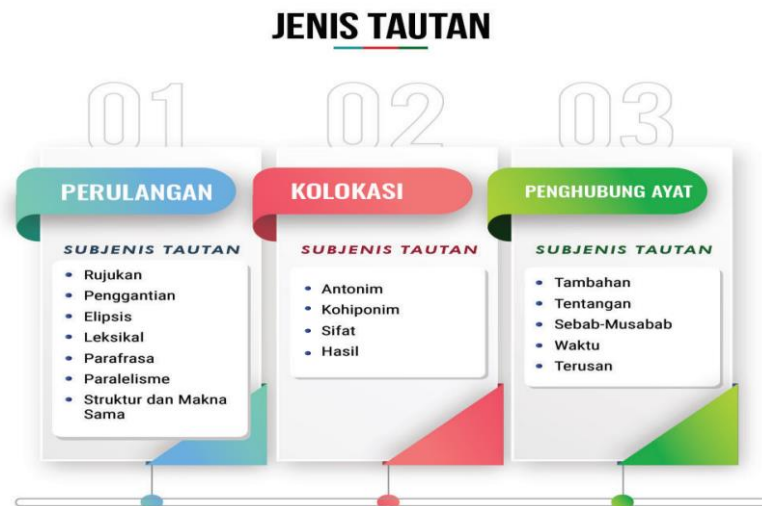
RAJAH 2. Model Tautan Pindaan (2002)

Zamri & Abdul Shukor (2009) telah memperkenalkan Model Pengajaran Unsur Tautan. Model ini berevolusi daripada MTP tetapi beberapa elemen telah disesuaikan semula agar lebih mudah diajar dan berupaya meningkatkan pemahaman konsep murid di bilik darjah. Sari, Hapizah, Susanti, & Scristia (2020) mengaitkan kesukaran pembelajaran dan pemahaman konsep yang rendah berpunca daripada bahan pengajaran dan model pembelajaran yang menggunakan istilah yang sukar difahami. Chairudin (2020) turut menjelaskan bahawa dengan menggunakan istilah yang mudah, murid akan memahami pernyataan guru dan akhirnya mereka dapat menguasai perkara yang disampaikan.