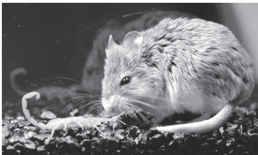
GAMBAR 2. Gambar seekor kala jangking yang sedang dimangsa oleh seekor tikus

dengan labah-labah yang mempunyai ekor panjang dengan sengat di bahagian hujung ekor tersebut.” Di samping itu, gambar berikut boleh diadakan.