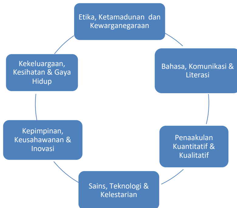
RAJAH 2: Enam Domain Pendidikan Citra UKM

Enam Domain Pendidikan Citra UKM boleh dilihat berkaitan antara satu sama lain. Rajah 3 menunjukkan perkaitan antara semua domain berkenaan. Domain Etika, Kewarganegaraan & Ketamadunan adalah domain asas yang menjadi teras utama dalam Pendidikan Citra UKM. Pelajar perlu diberi pendedahan yang mencukupi tentang aspek-aspek nilai, integriti, kewarganegaraan dan ketamadunan yang akan membina jatidiri sahsiah yang kukuh. Domain Bahasa, Komunikasi & Literasi, Kepimpinan, Keusahawanan & Inovasi dan Penaakulan Kuantitatif & Kualitatif adalah domain pembelajaran pelajar untuk mendapatkan pengetahuan dan kemahiran-kompetensi asas yang diperlukan dalam membangunkan peradaban manusia. Domain Kekeluargaan, kesihatan & Gaya Hidup serta Sains, Teknologi dan Kelestarian memberi peluang pelajar mendapatkan pengetahuan dan kemahiran dalam aspek-aspek aplikasi kehidupan berkeluarga, bermasyarakat dan juga sedar dan mengetahui sumbangan sains dan teknologi dalam kelestarian peradaban manusia. Oleh kerana itulah, Pendidikan Citra sebenarnya membawa pelajar kepada aspek pembelajaran yang komprehensif dan berorientasikan pendekatan shaping the mind, building the character pelajar semasa dalam pengajian dan juga selepas bergraduat. Secara tidak langsung, Pendidikan Citra membentuk identiti diri atau brand pelajar UKM yang dihormati.