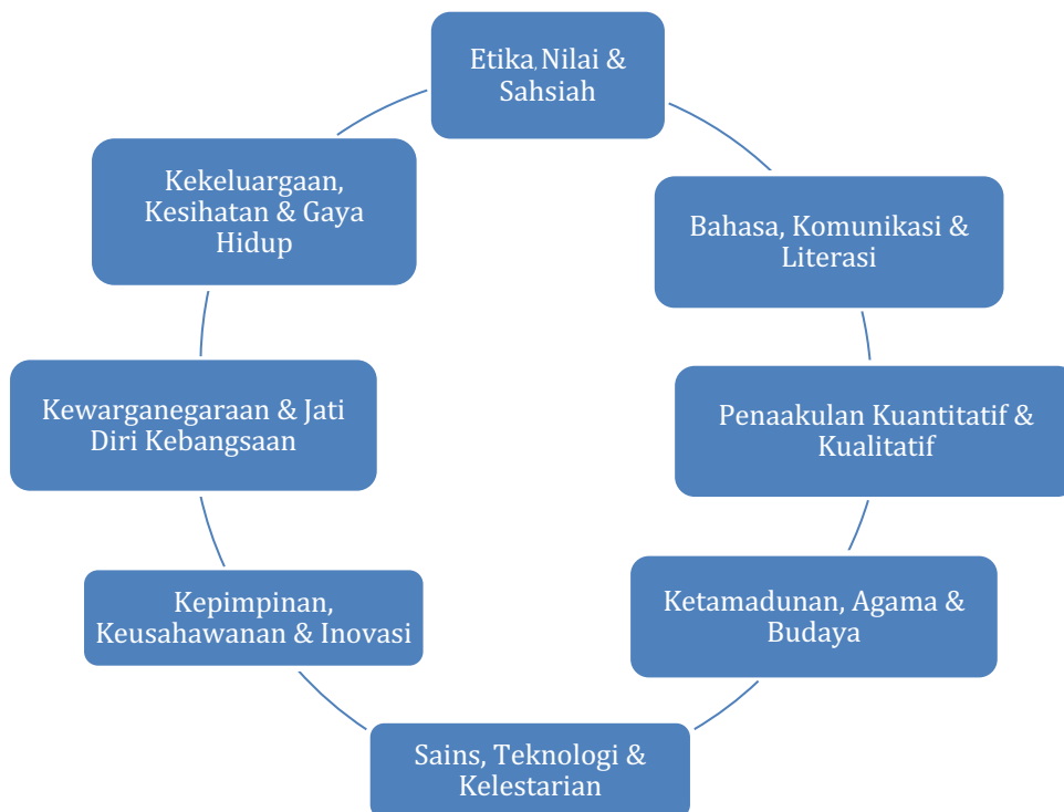
RAJAH 1: Lapan domain Pendidikan Citra UKM

Hasil daripada pembentangan dan cadangan Mesyuarat Pengurusan Universiti (MPU) bilangan 1/2014 bertarikh 21 Januari 2014, lapan domain asal Pendidikan Citra UKM telah dipinda kepada enam domain. Tiga domain yang digabungkan ialah Domain Etika, Nilai dan Sahsiah, Domain Ketamadunan, Agama dan Budaya dan Domain Kewarganegaraan dan Jati Diri Kebangsaan telah menjadi Domain Etika, Kewarganegaraan dan Ketamadunan (Lihat Rajah 2). Dalam mesyuarat yang sama juga, Jawatankuasa Pelaksana Pendidikan Citra UKM telah ditubuhkan bagi merancang dan menjalankan pelaksanaan Pendidikan Citra UKM yang dijangka akan dimulakan pada Semester 2014-2015.