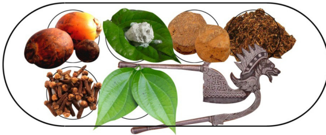
Gambar 2: susunan bahan-bahan di dalam tepak sirih.

Tepak juga membawa makna bahawa jika wanita bersetuju menerima pinangan lelaki, wanita tersebut juga mesti bersedia menerima segala cabaran yang bakal dihadapi dalam frasa kehidupan seterusnya. Bahan-bahan di dalam tepak yang diletakkan di dalam bekas kecil dinamakan cembul mempunyai pelbagai rasa seperti kapur yang mempunyai rasa pedas dan panas, gambir dan tembakau yang mempunyai rasa kelat dan cengkik yang mempunyai rasa segar. Daun sirih di dalam tepak mewakili wanita yang sentiasa dijaga maruahnya kerana ia diletakkan di dalam tepak yang bertutup. Daun sirih melambangkan wanita sebagaimana kehidupan pokok sirih yang tidak boleh hidup di kawasan terbuka dan perlu mempunyai sokongan untuk hidup. Daun sirih untuk adat meminang tidak boleh menggunakan daun sirih bertemu urat kerana daun sirih bertemu urat hanya digunakan untuk tujuan perubatan.