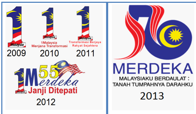
Gambar 2.0: Logo Hari Kemerdekaan Malaysia 2009-2013

Berikut merupakan logo-logo yang telah dicipta sempena sambutan Hari Kemerdekaan Malaysia semenjak tahun 1976 sehingga tahun 2012. Pada dasarnya logo-logo tersebut bercorak abstrak dan konsisten setiap tahun. Jelas kelihatan logo-logo dicipta menggunakan warna asas bendera Malaysia iaitu Jalur Gemilang kecuali logo yang dicipta pada tahun 1977.