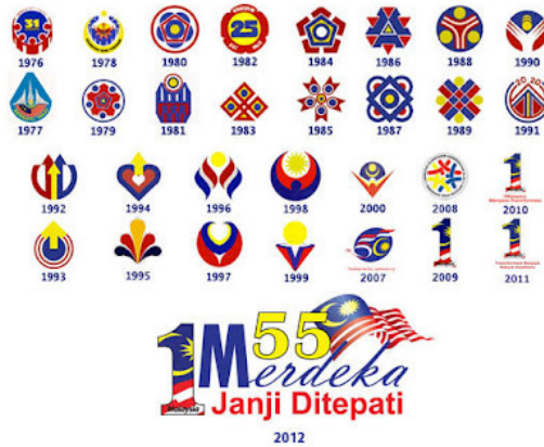
Gambar 1.0: Logo Hari Kemerdekaan Malaysia dari tahun 1976 hingga 2012

Kemerdekaan seperti bentuk bulat, orang, tangan dan sebagainya.